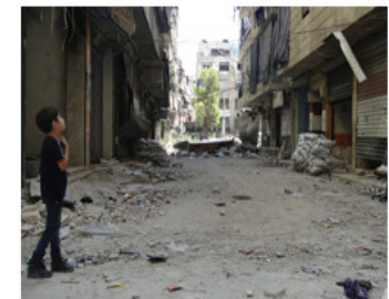
Millions of children suffer the consequences of the Syrian conflict.