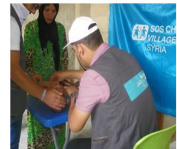
Until October 2016, SOS Children's Villages provided vital medical help to parents and children in war-torn Aleppo